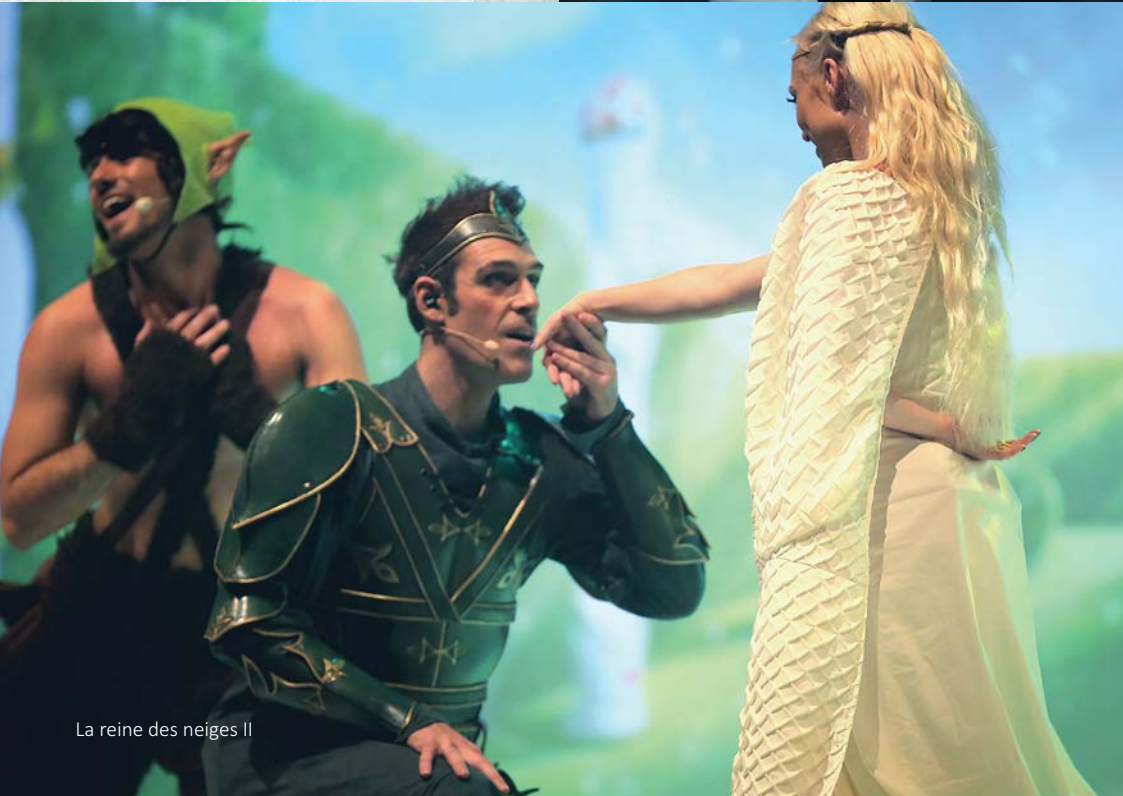
La reine des neiges II