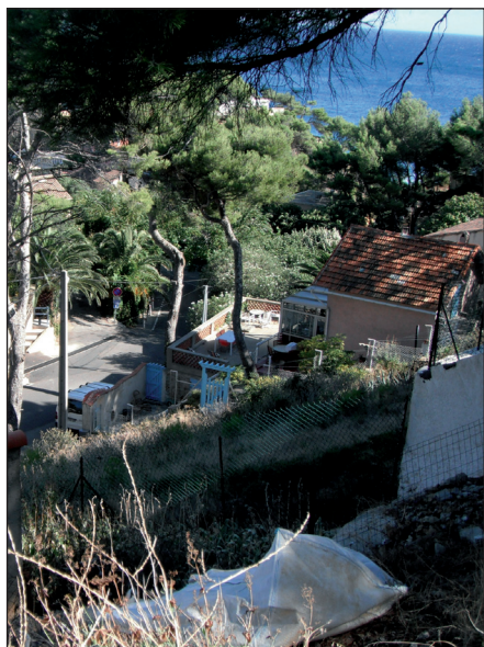
Chemin de la Madrague de Gignac et du chemin de la Redonne