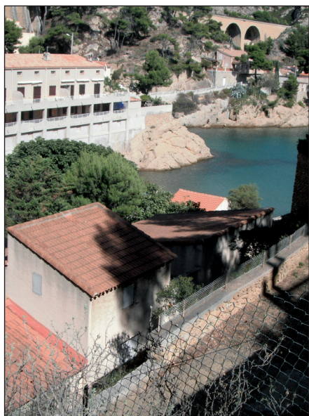
Chemin du Pebraire et du chemin de la Redonne